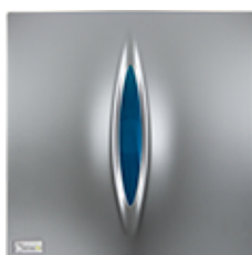
Azul · PGC4025G