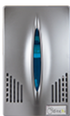
Azul · MLC525G