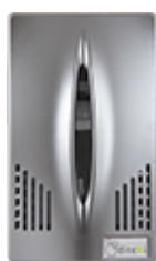
Fumé · ML500G