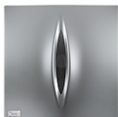
Fumé · PM3000G