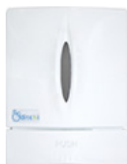
Fumé · JP800