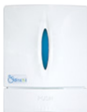
Azul · JPC825