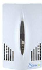
Fumé · ML500