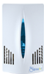
Azul · MLC525