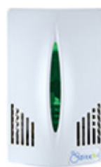
Verde · MLC550